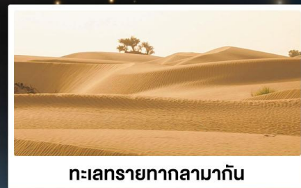
ทะเลทรายทากลามากัน