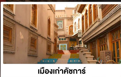
เมืองเก่าคัชการ