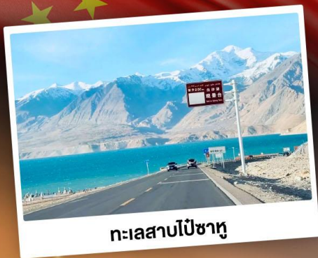
ทะเลสาบโป้ซาหู

“ซินเจียงใต้” ดินแดนแห่งทะเลทราย สัมผัสวัฒนธรรมของชาวซินเจียงอุยกูร์